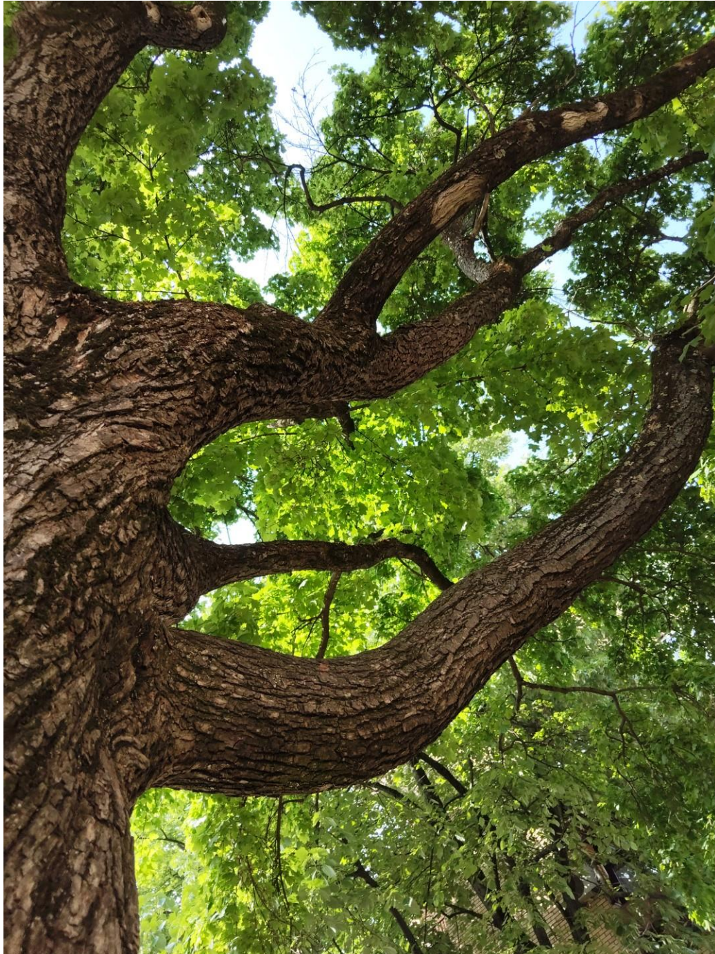
Lovro Majdandžić, OŠ „Mladost“ Osijek

(Bilo mlado ili staro, svako drvo dio je iste šume: 474 , Ovo nanosi boli našoj majci Prirodi: 243 )